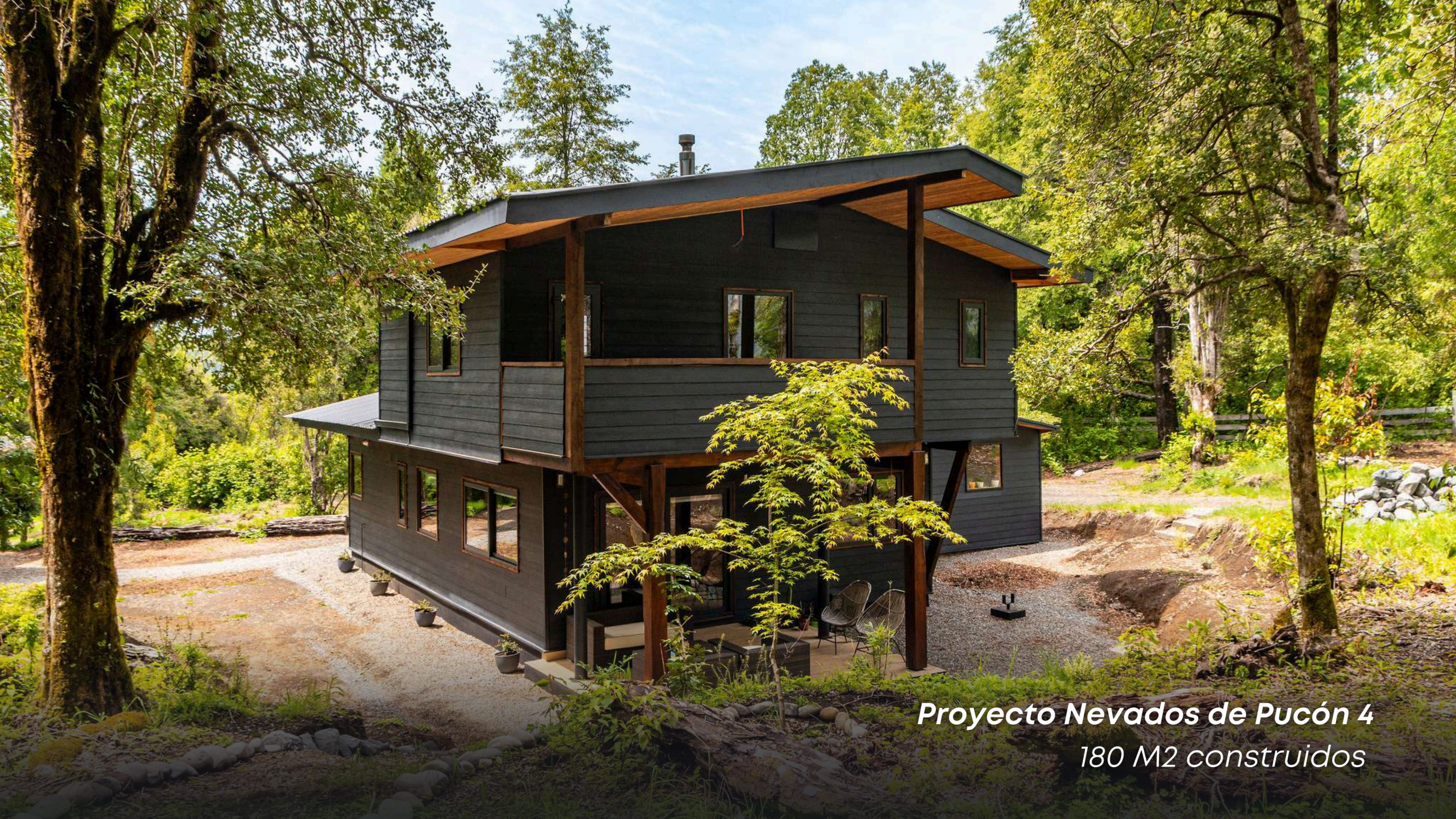
Proyecto Nevados de Pucón 4 180 M2 contruidos