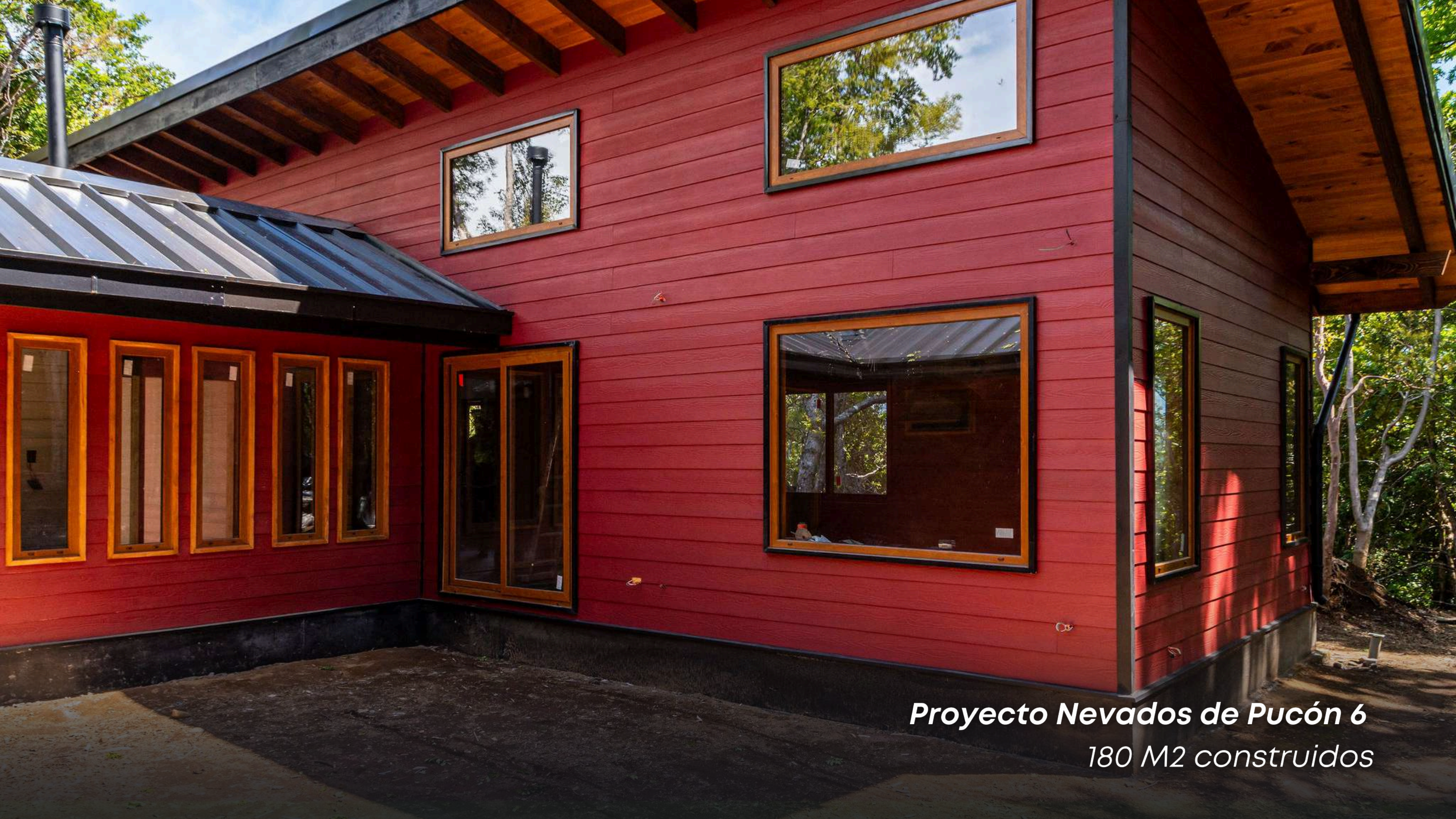
Proyecto Nevados de Pucón 6 180 M2 contruidos