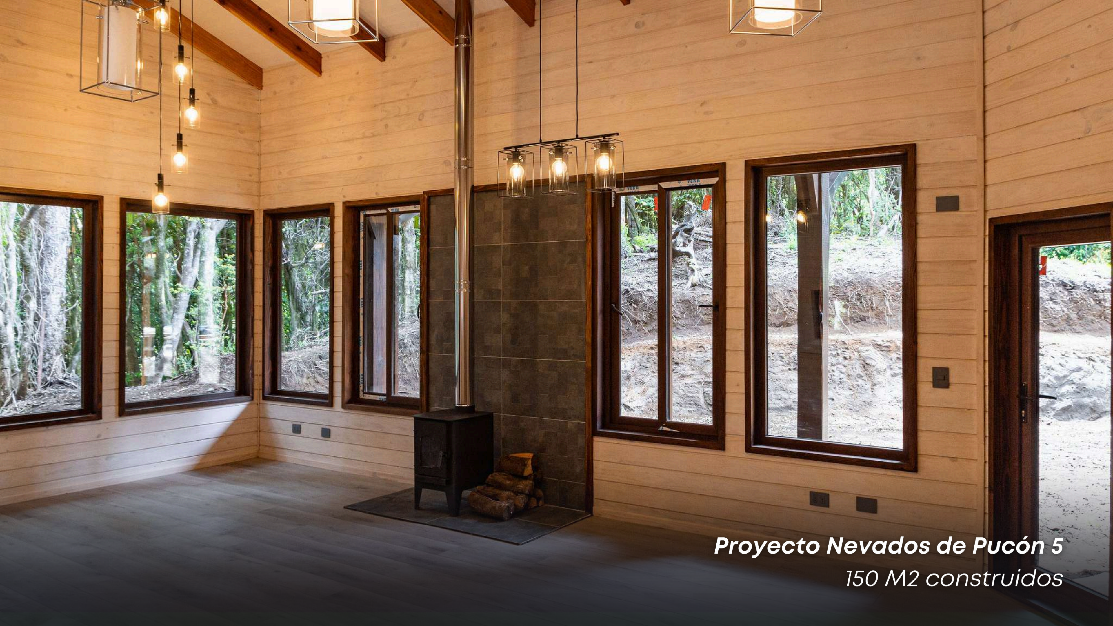
Proyecto Nevados de Pucón 5 150 M2 contruidos