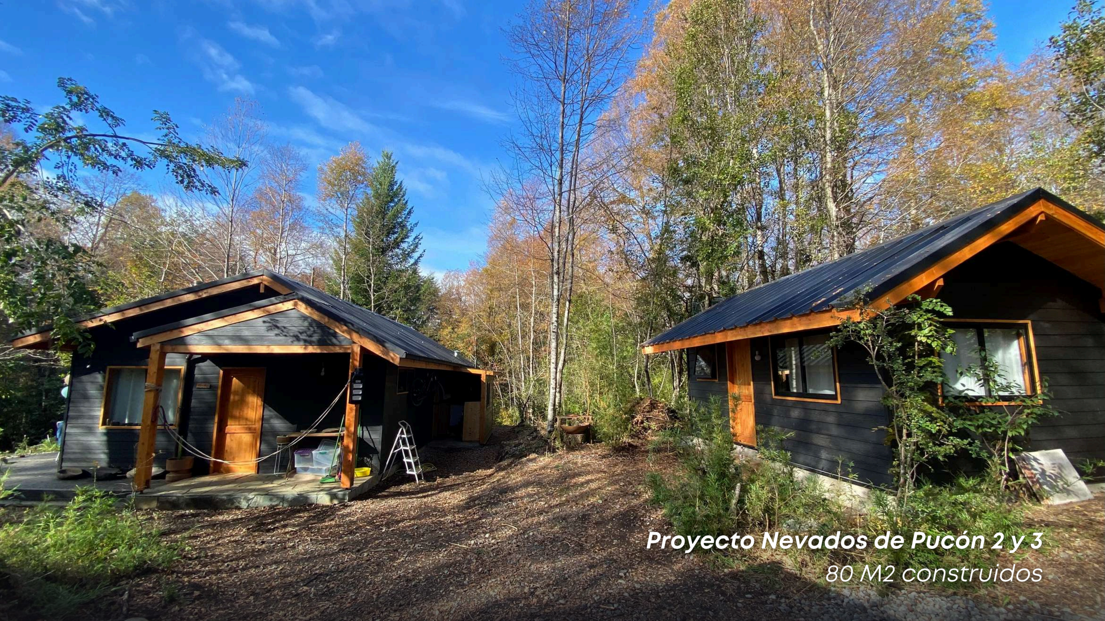
Proyecto Nevados de Pucón 2 y 3 80 M2 contruidos